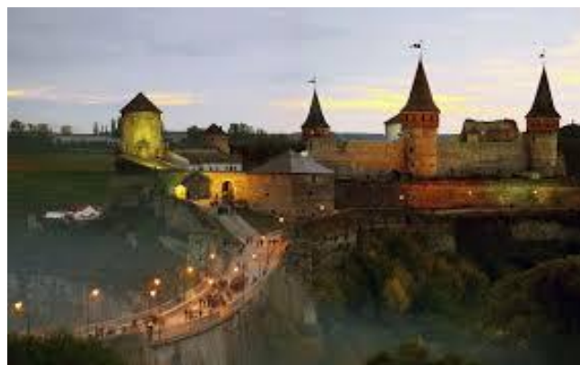
Кам'янець Подільська фортеця