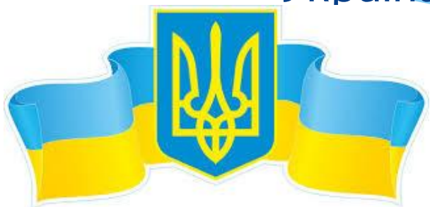
Герб і прапор